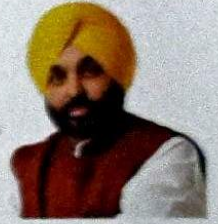
ਭਗਵੰਤ ਸਿੰਘ ਮਾਨ ਮੁੱਖ ਮੰਤਰੀ, ਪੰਜਾਬ

“ਪੰਜਾਬ ਦੇ ਪਿੰਡ ਸਾਡੀ ਸੋਹਣੀ ਸੱਭਿਆਚਾਰਕ ਵਿਰਾਸਤ ਨੂੰ ਦਰਸਾਉਂਦੇ ਹਨ। ਫਾਰਮ ਸਟੇਅ ਨੀਤੀ 2026 ਰਾਹੀਂ ਅਸੀਂ ਕਿਸਾਨਾਂ ਲਈ ਆਮਦਨ ਦੇ ਨਵੇਂ ਮੌਕੇ ਪੈਦਾ ਕਰਨ ਦੇ ਨਾਲ-ਨਾਲ ਪੇਂਡੂ ਸੈਰ-ਸਪਾਟੇ ਨੂੰ ਉਤਸ਼ਾਹਿਤ ਕਰਨਾ ਅਤੇ ਪੰਜਾਬ ਦੀ ਅਸਲ ਰੂਹ ਨੂੰ ਦੁਨੀਆ ਸਾਹਮਣੇ ਲਿਆਉਣਾ ਚਾਹੁੰਦੇ ਹਾਂ।